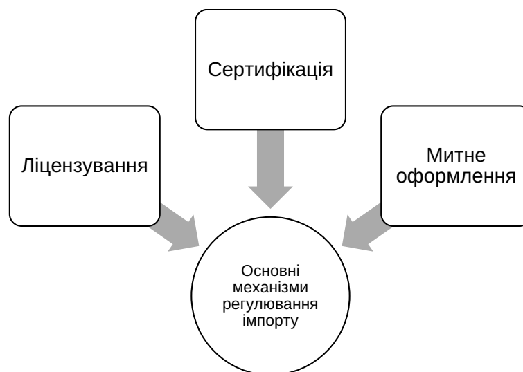
Рис. 2. Основні механізми регулювання імпорту продовольства та товарів для агропромислового виробництва в Україні

Окрім цього, звернемо увагу на постанову КМУ «Про затвердження переліків товарів, експорт та імпорт яких підлягає ліцензуванню, та квот на 2024 рік». Положення цієї постанови визначає обсяг квот товарів, імпорт яких підлягає ліцензуванню, зокрема тих товарів, які можуть містити контрольовані речовини (озоноруйнівні речовини та фторовані парникові гази). Це речовини, що використовуються в агропромисловому секторі, а також обладнання. При цьому, немає чітко встановленого обсягу квот товарів, імпорт яких підлягає ліцензуванню, який був би аналогічним переліку таких товарів у контексті експорту [11].