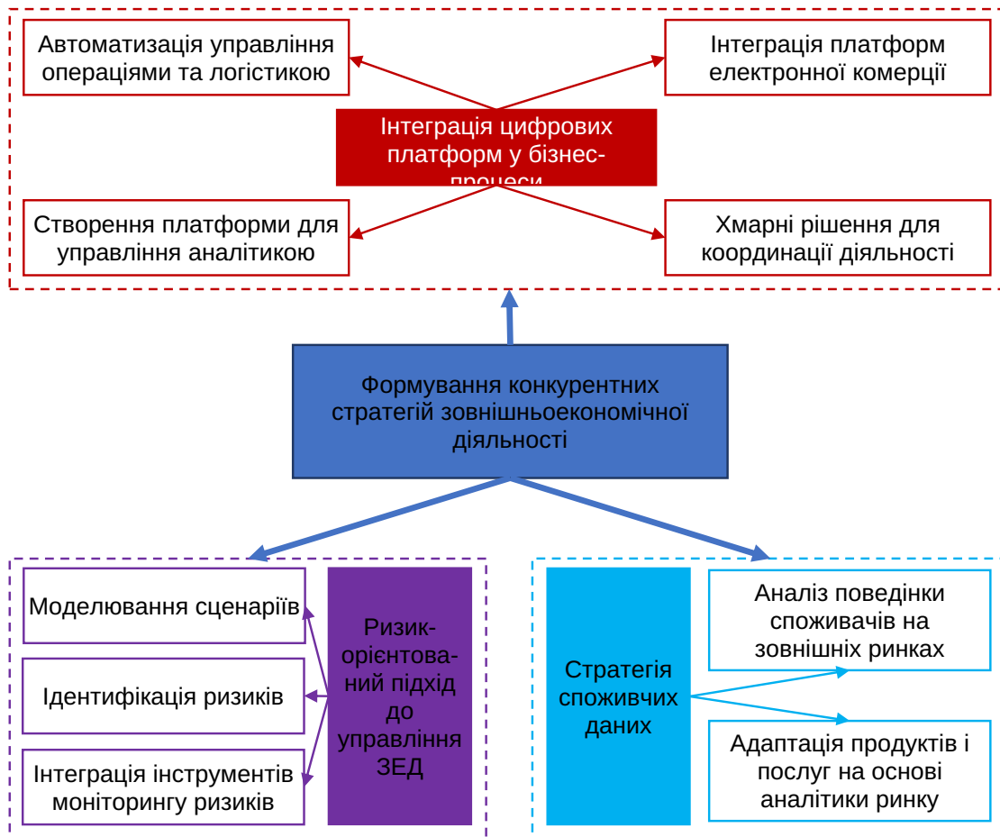
Рис. 2. Інноваційні підходи до розробки стратегій зовнішньоекономічної діяльності, спрямованих на підвищення конкурентоспроможності підприємств