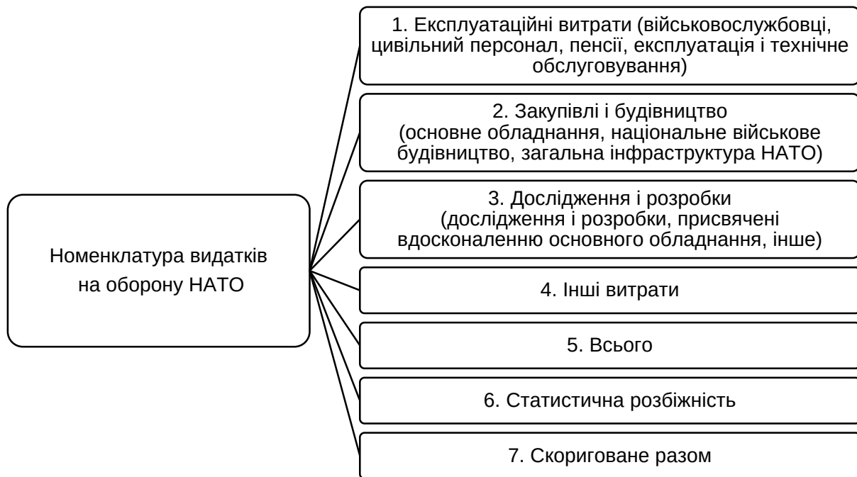
Рис. 1. Номенклатура видатків на оборону в країнах НАТО