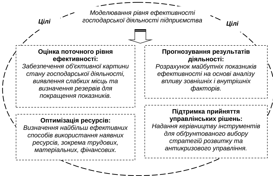
Рис. 2. Цілі моделювання рівня ефективності господарської діяльності підприємства