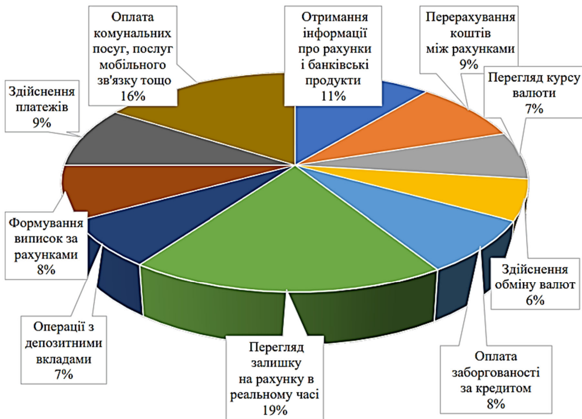
Рис. 2. Найбільш популярні послуги інтернет-банкінгу в Україні

Лідерами серед банків, які активно розвивають Інтернет-банкінг в Україні є «ПриватБанк», «Сенсе-Банк», «ОТП Банк», «УкрСиббанк», «Universal Bank», «ПУМБ». Найпопулярнішим з онлайн-банків на сьогоднішній день є «Monobank», який є проектом на базі «Universal Bank». Він надає широкий спектр зручних банківських сервісів для користувачів смартфонів. Банк є повністю віртуальним, та зато-