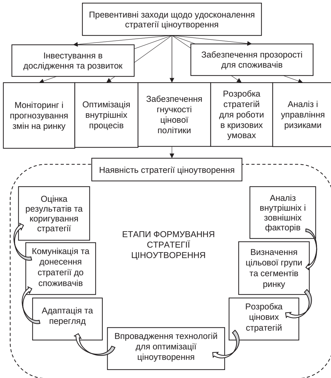
Рис. 4. Особливості ціноутворення як інструменту підвищення ефективності діяльності підприємств у контексті використання превентивних підходів в умовах сучасних викликів безпекового середовища