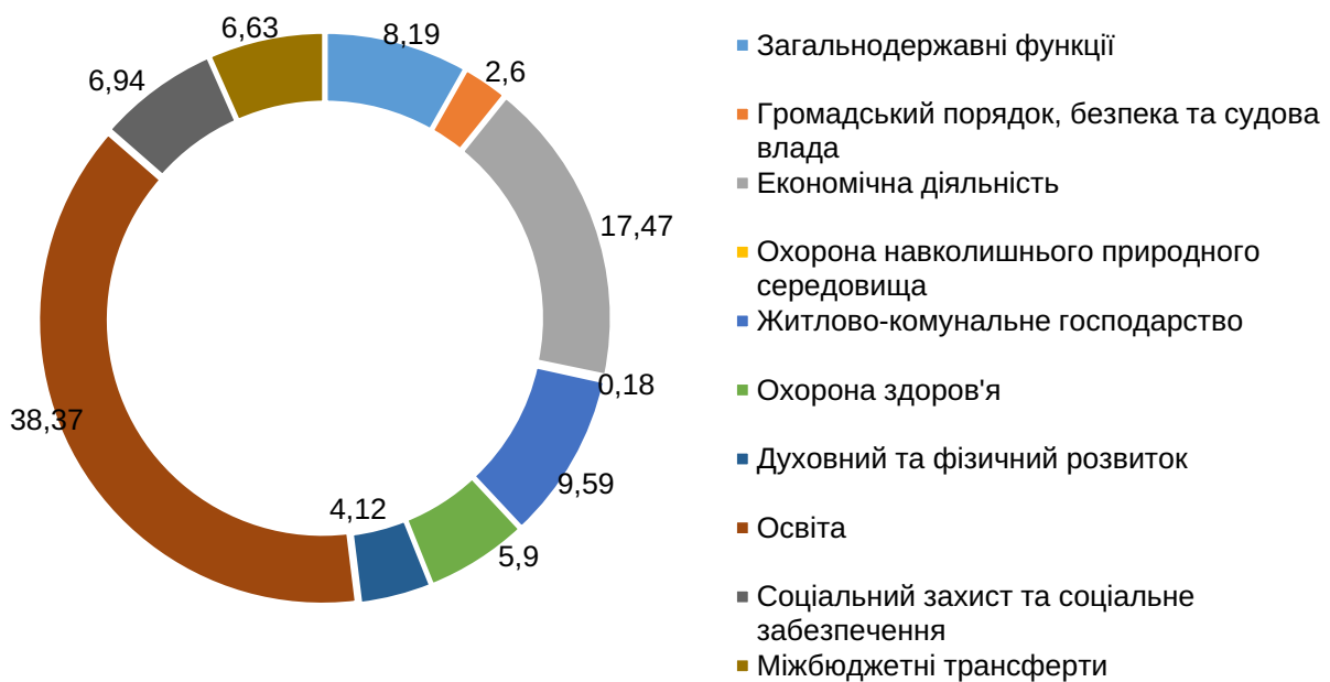
Рис. 4. Структура місцевих бюджетів за видатками за 2023 рік, %