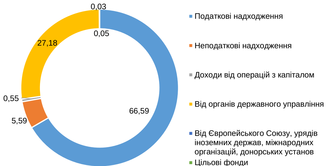
Рис. 3. Структура місцевих бюджетів за доходами за 2023 рік, %