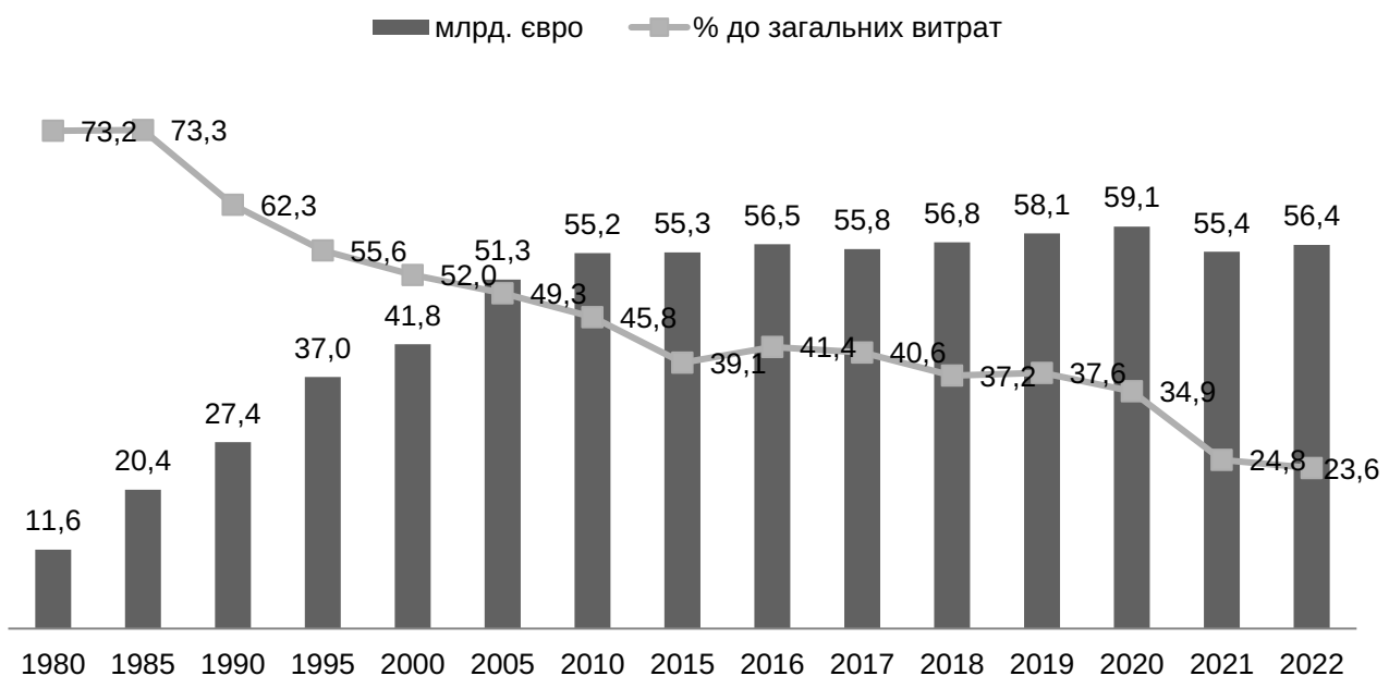
Рис. 1. Витрати ЄС на ССП 1980-2022 роки

Потрібно відмітити що окрім ССП в ЄС є інші програми які не прямо, але опосередковано направлені на розвиток фермерів. Зокрема програма Horizon Europe направлена на фінансування досліджень та інновацій у різних сферах, зокрема у сфері продуктів харчування, біоекономіки, природних ресурсів, сільського господарства та навколишнього середовища.