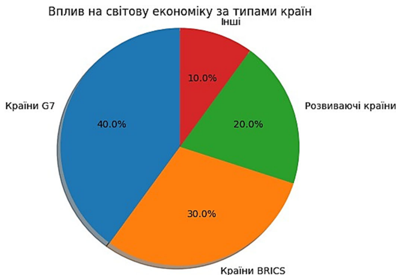
Рис. 1. Частки внеску країн у світову економіку

Також важливим є вивчення культурних та соціальних аспектів, які є частиною економічних відносин. Культурна експлуатація та зміни, викликані глобалізацією, призводять до знищення місцевих традицій та ідентич-