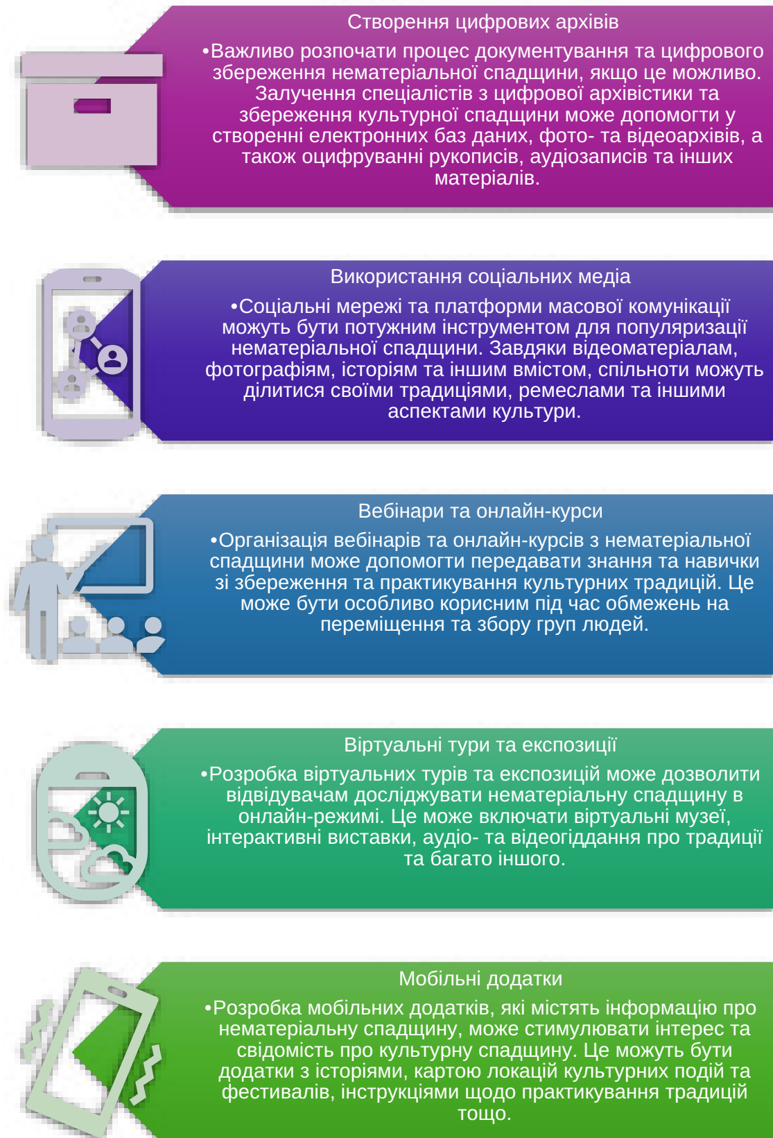
Рис. 2. Взаємодію глобалізації, збереження українських традицій та культурної спадщини в умовах сучасних викликів