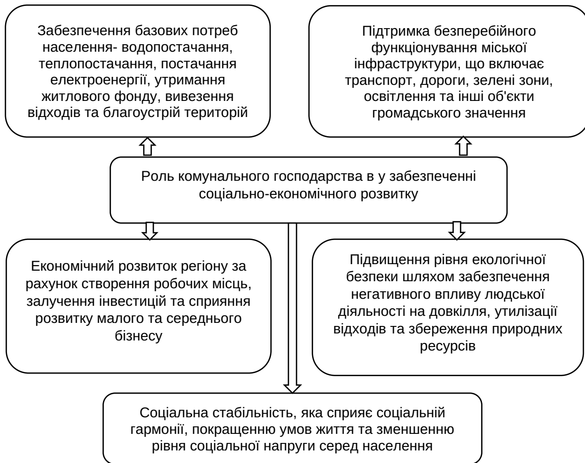
Рис. 1. Роль комунального господарства у забезпеченні соціально-економічного розвитку