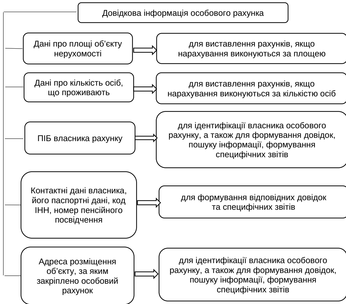
Рис. 3. Довідкова інформація особового рахунка