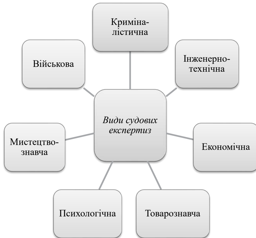
Рис. 1. Види судових експертиз в Україні [3]

та експертних досліджень (далі – Інструкція) [3] та Науково-методичні рекомендації з питань підготовки та призначення судових експертиз та експертних досліджень [8].