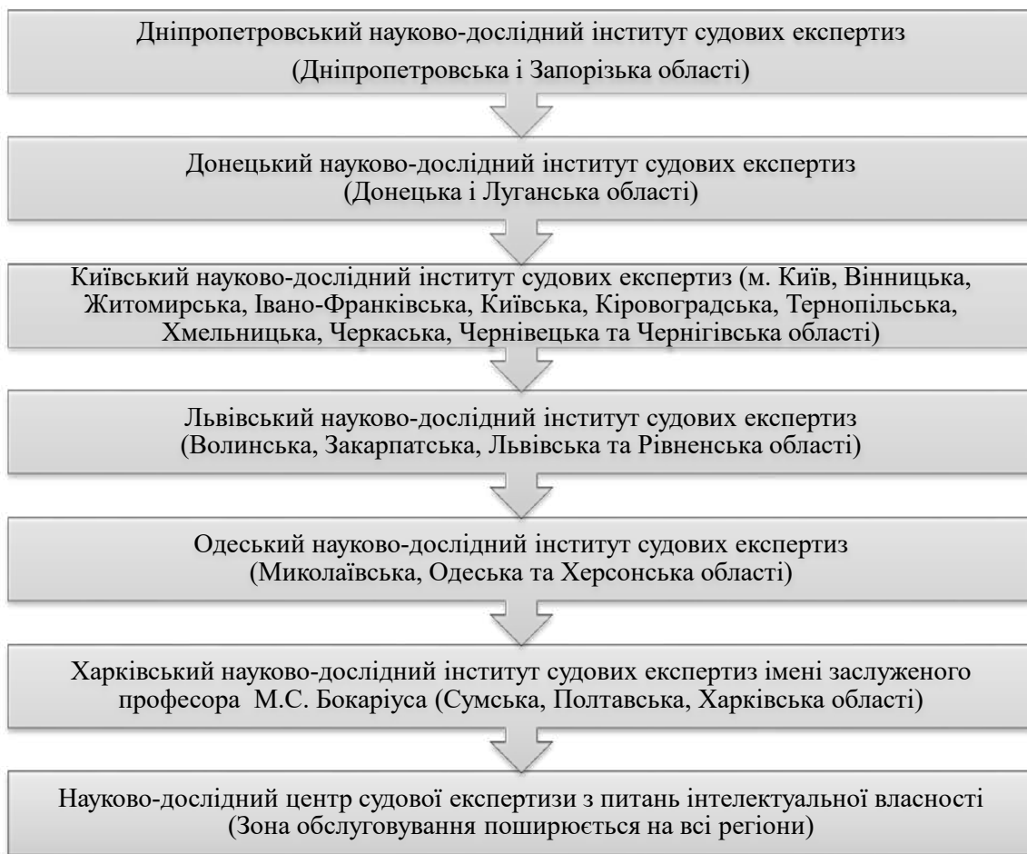
Рис. 2. Склад регіональних зон обслуговування науково-дослідних установ судових експертиз Міністерства юстиції України [3]