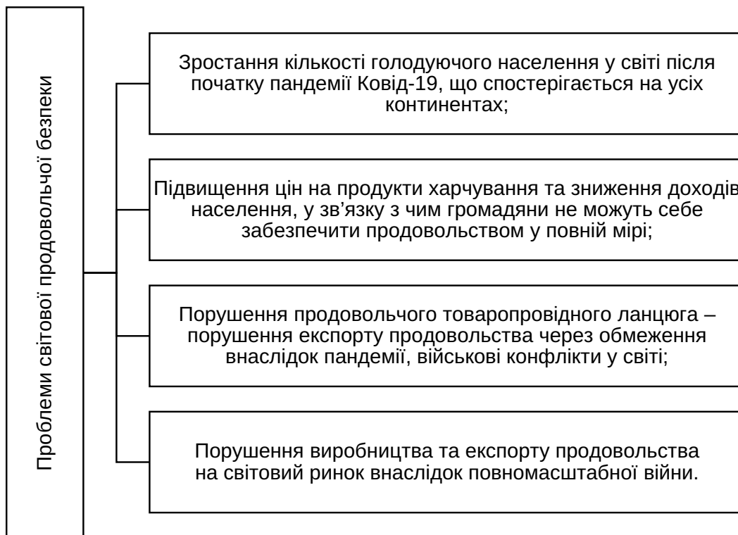
Рис. 1. Проблеми світової продовольчої безпеки

Аналізуючи динаміку виробництва продовольства за континентами, зазначимо, що загальна динаміка протягом останніх років змінюється несуттєво. Найбільш важливою тенденцією є збільшення частки Азії у загальному обсязі виробництва, що є характерним для останніх десятиліть. Також збільшується частка Америки, зокрема – Бразилії.