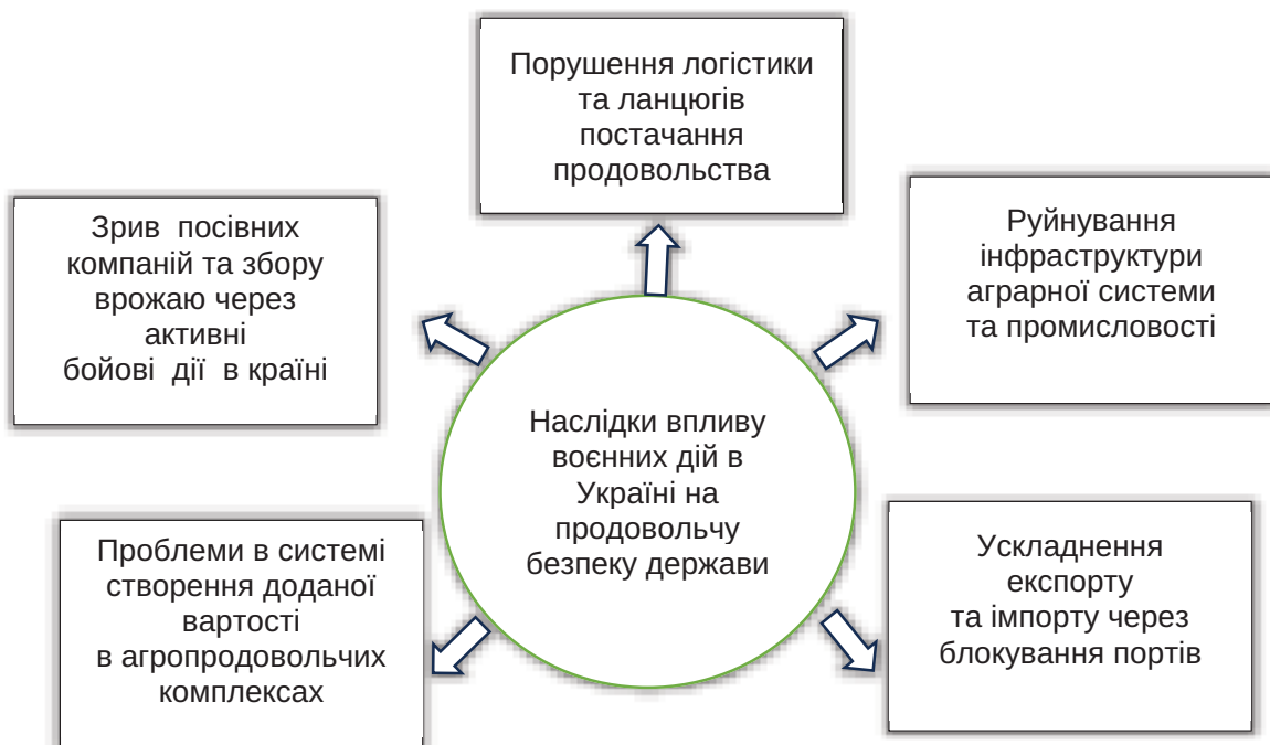
Рис. 2. Наслідки негативного впливу воєнних дій в Україні на продовольчу безпеку держави

Продовольча безпека для України в найближчій перспективі є одночасно політичним та соціально-економічним пріоритетом і викликом. Стратегічні заходи для забезпечення довготривалої продовольчої безпеки та зміцнення ролі України в глобальних зусиллях