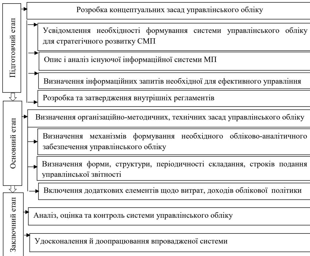
Рис. 2. Алгоритм запровадження системи управлінського обліку СМП