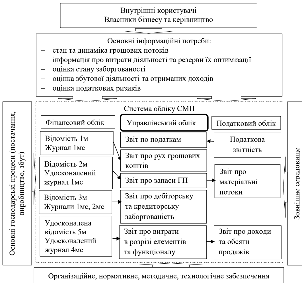
Рис. 1. Схема організації управлінського обліку малими підприємствами