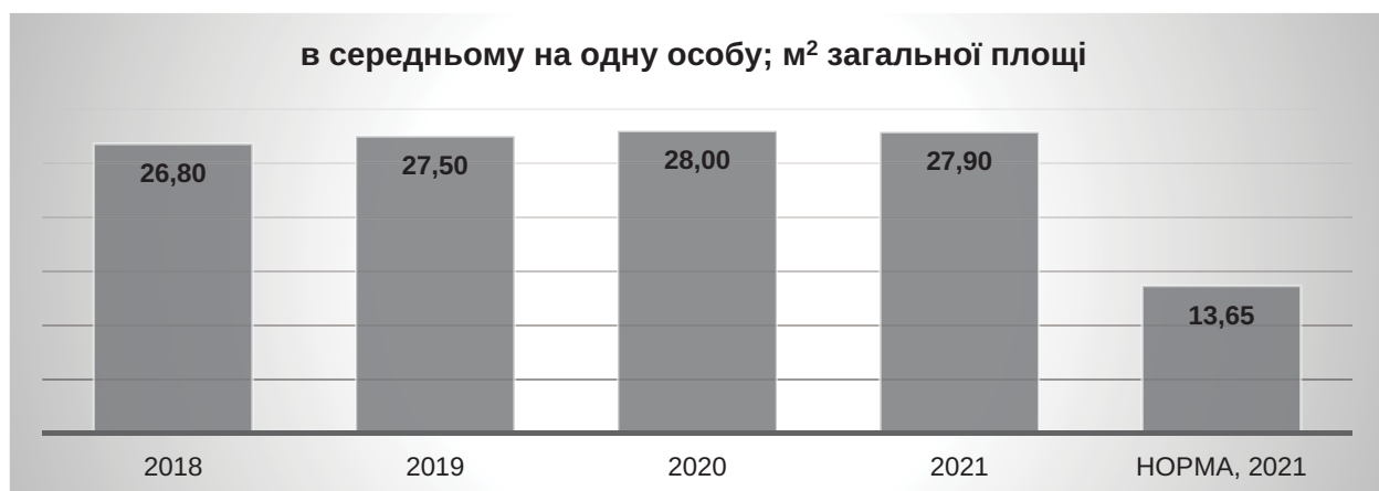
Рис. 1. Аналіз житлового забезпечення сільського населення у період 2018–2021 років

Поліпшення побутових умов має безпосередній вплив на привабливість агросадиб для споживачів туристичних послуг, що, у свою чергу, сприяє розвитку сільського зеленого туризму. Власники таких садиб можуть використовувати підвищення рівня умов проживання для відповідного підвищення вартості проживання, оскільки зростає цінність послуг, які вони пропонують туристам. Однак, існуючий рівень комфорту багатьох сільських садиб часто не відповідає сучасним стандартам. Це створює додаткові труднощі у реалізації