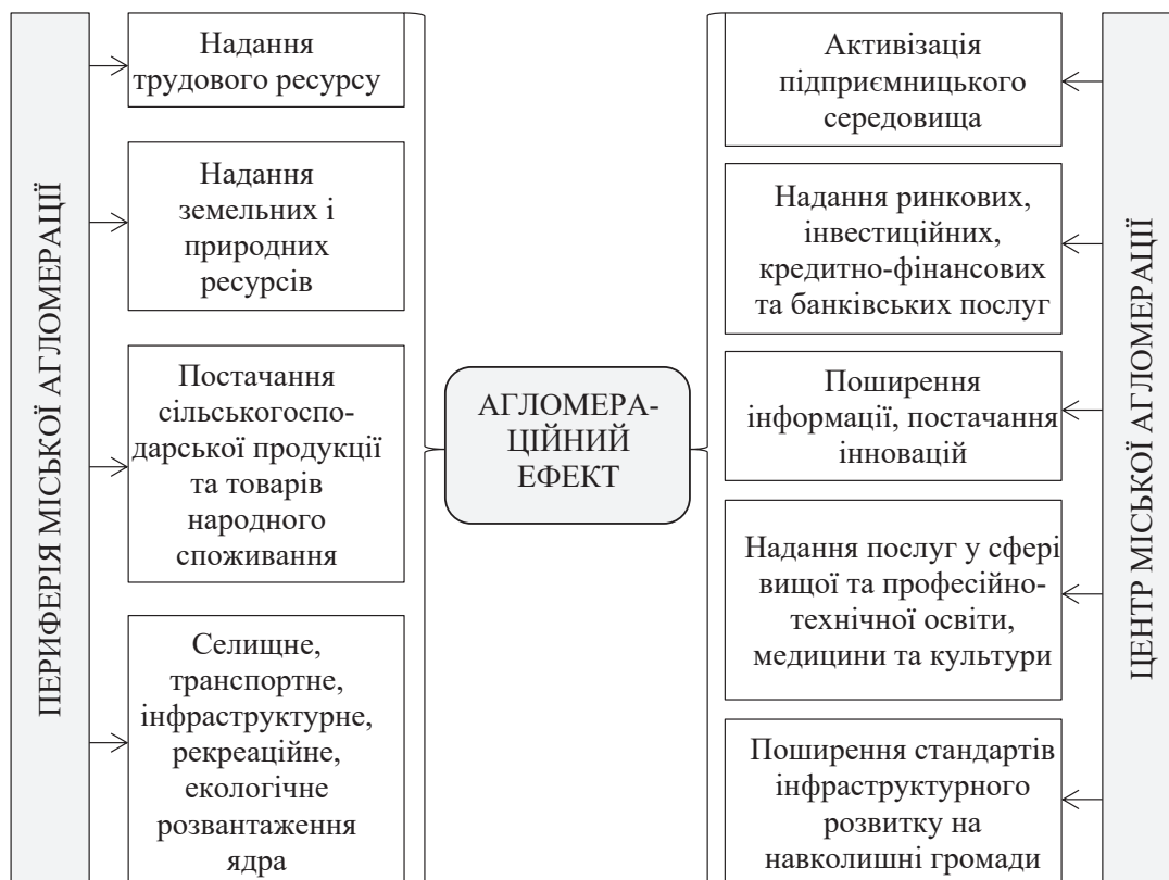
Рис. 1. Агломераційний ефект взаємодії центру та периферії міської агломерації

Р. Кізіма відзначає такі позитивні ефекти від формування міської агломерації: