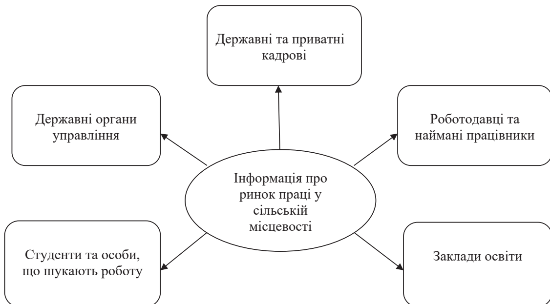
Рис. 2. Основні споживачі інформації про ринок праці у сільській місцевості

Інформація про ринок праці вкрай необхідна і для розробки політики та плану-