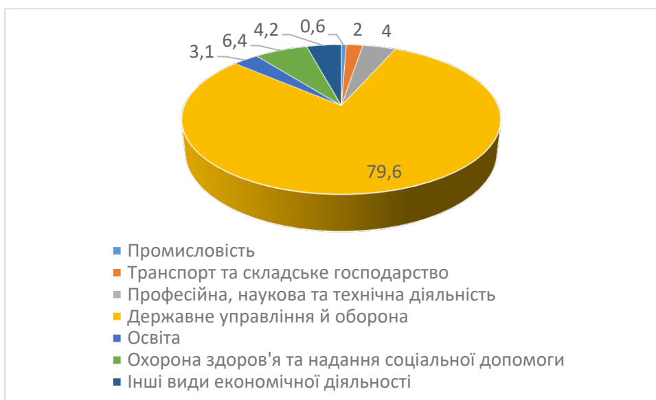
Рис. 2. Динаміка питомої ваги капітальних інвестицій в Україні за рахунок бюджетних коштів у 2010 – 2021 роках