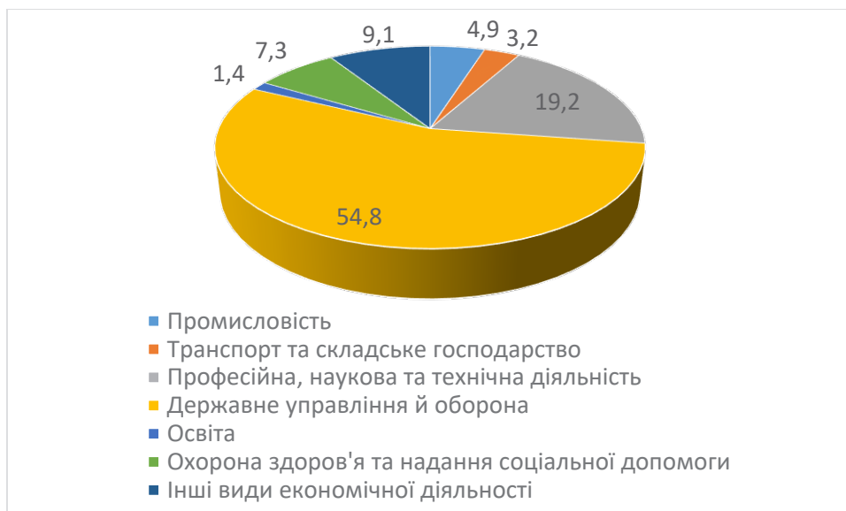
Рис. 4. Структура капітальних інвестицій за рахунок коштів місцевих бюджетів України за видами економічної діяльності у 2021 році, %