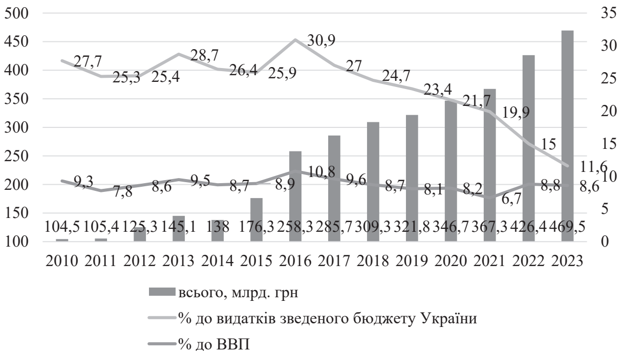
Рис. 1. Динаміка видатків зведеного бюджету України на соціальний захист та соціальне забезпечення

В цілому, частка видатків на соціальний захист та соціальне забезпечення у структурі видатків зведеного бюджету найбільше значення мала у 2013 році та 2016 році – 28,7% та 30,6%, відповідно. У 2023 році частка видатків на соціальний захист та соціальне забезпечення у структурі видатків зведеного бюджету суттєво знизилася і становила 15%, що є най-