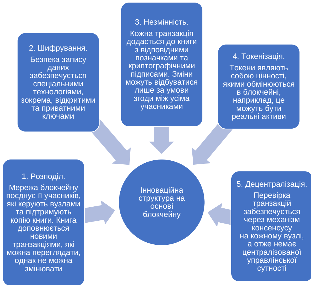
Рис. 3. Складові інноваційної структури на основі блокчейну