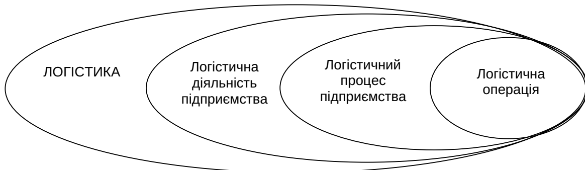
Рис. 1. Відповідність основних категорій у логістиці

Уся сукупність логістичних процесів підприємства реалізується задля одержання визначених результатів та при цьому досягнення комплексної оптимізації логістичних операцій одночасно із мінімізацією витрат на їх здійснення.