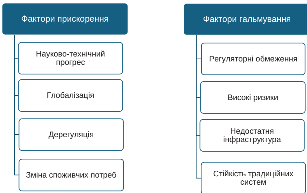
Рис. 2. Фактори впливу на розвиток фінансових інновацій

Науково-технічний прогрес продовжує бути ключовим драйвером для розвитку інноваційних фінансових інструментів. Попри складні умови, українські фінансові інституції активно впроваджують нові технології, такі як блокчейн, штучний інтелект та великі дані, для підвищення прозорості та ефективності своїх операцій. Криптовалюти, зокрема, стали важливим інструментом для фінансових операцій в умовах нестабільності традиційних фінан-