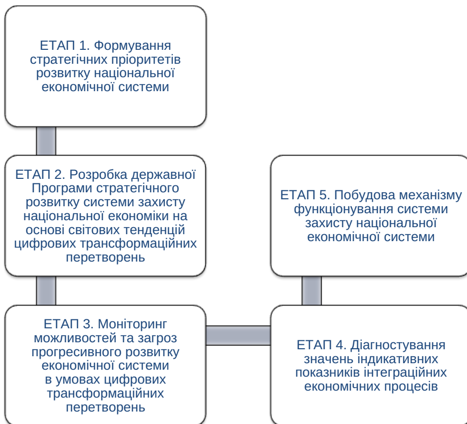
Рис. 2. Етапи побудови механізму захисту національної економіки в умовах повномасштабного воєнного вторгнення

3) реалізації рішення (уживаються заходи для конкретизації управлінського рішення та доведення його до виконавців, здійснюється контроль за процесом його виконання, вносяться необхідні зміни та оцінюється отриманий результат від виконання управлінського рішення. Кожне рішення має свій конкретний результат, тому загальною метою управлінської діяльності є знаходження таких методів, форм, засобів та інструментів, які могли б сприяти досягненню оптимального результату в конкретних умовах).