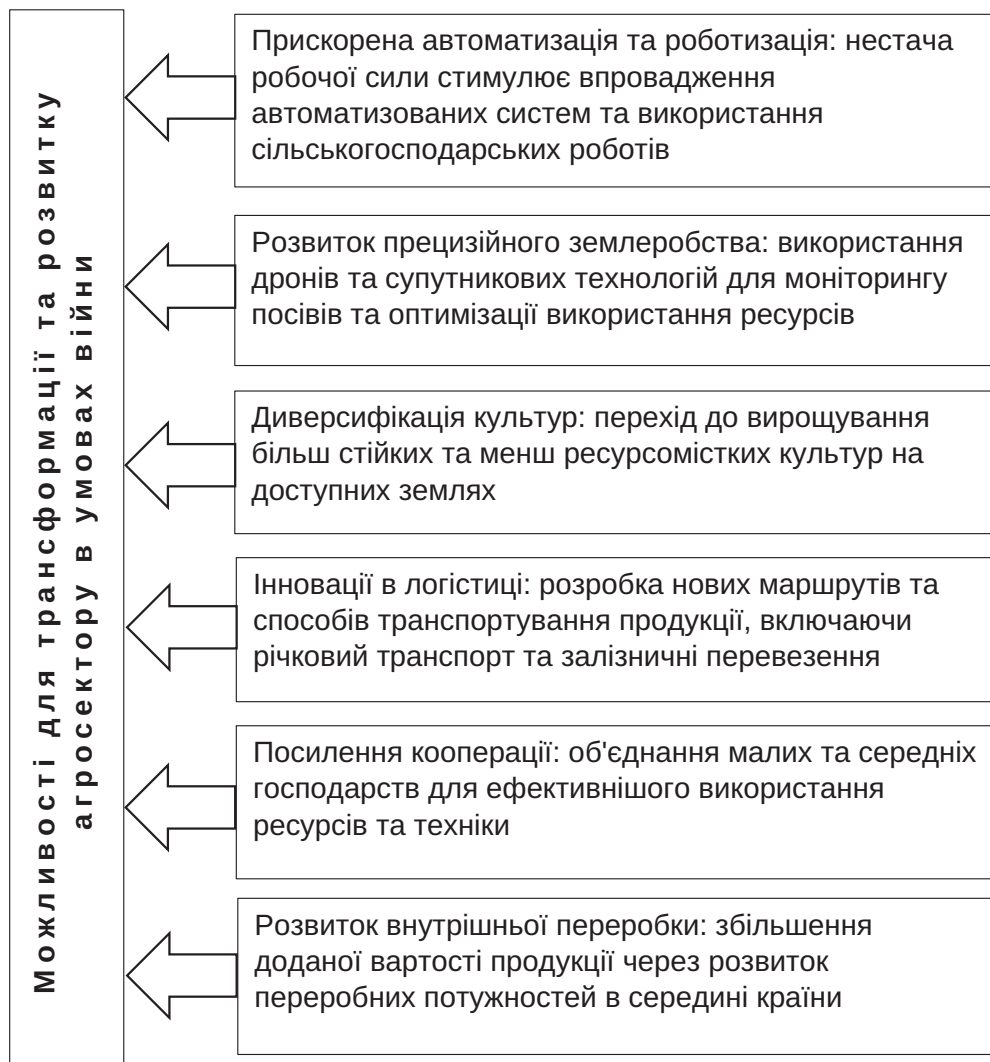
Рис. 2. Основні можливості для трансформації та розвитку агросектору в умовах війни

– підтримки національного духу та морального стану як військових, так і цивільних;