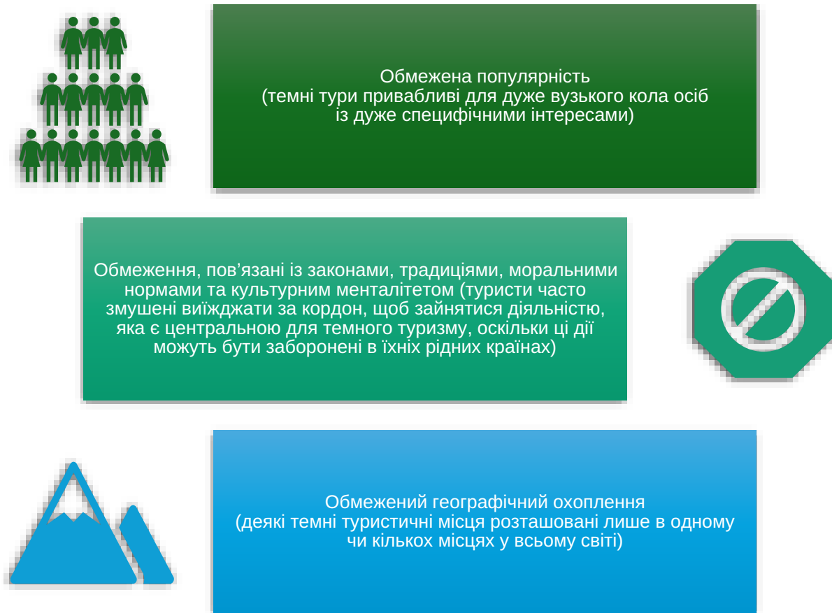
Рис. 2. Основні характеристики темного туризму [2, с. 27–34]

та підтримки постраждалих спільнот. Війна створює нові місця історичного значення, які можуть стати об'єктами темного туризму. Цей вид туризму сприяє усвідомленню історичних уроків, підвищенню міжнародної поінформованості про конфлікт та формуванню глобальної солідарності проти насильства.