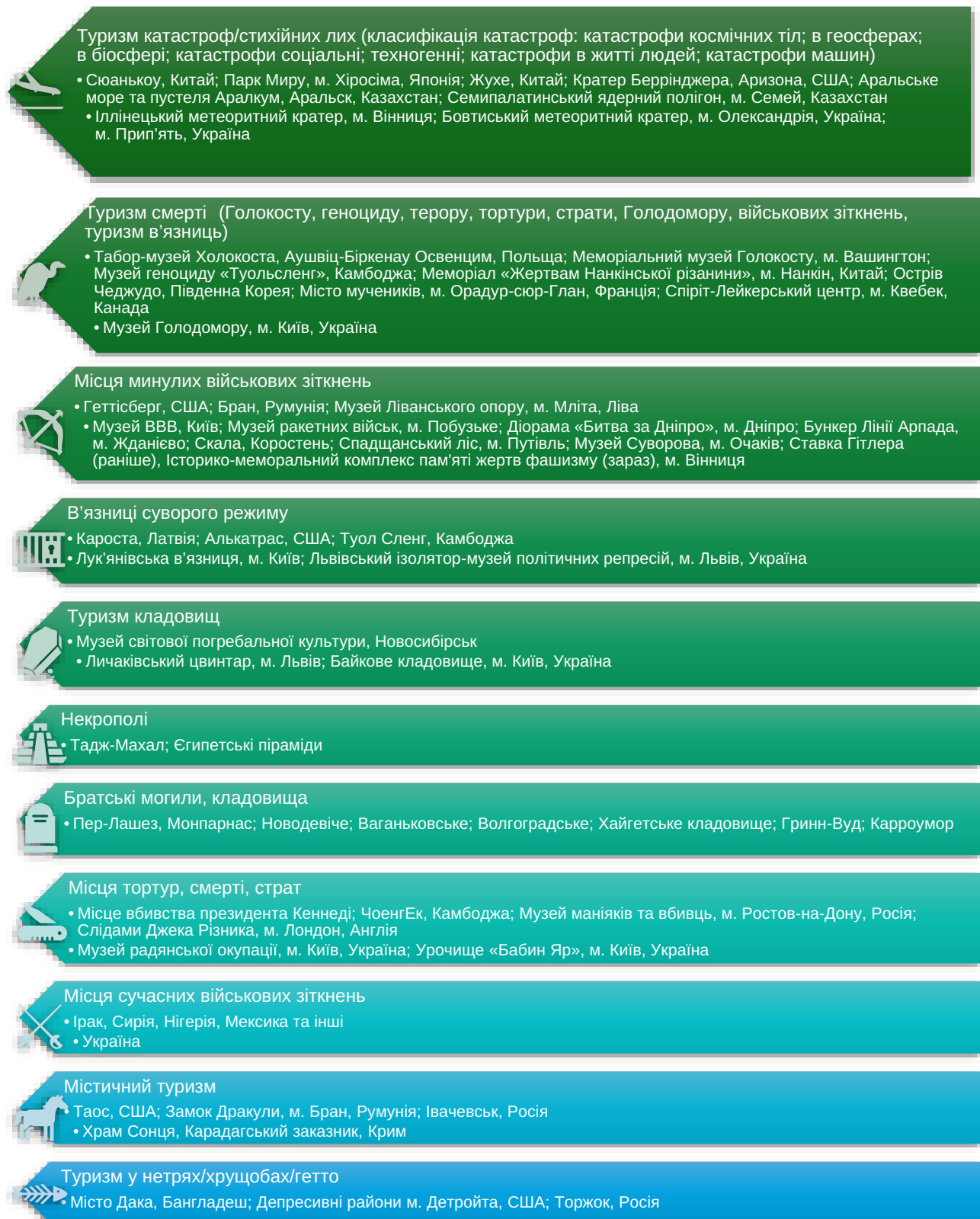
Рис. 1. Класифікація видів темного туризму по Шильніковій З. М., Дульцевій І. І. та Матушкіній М. В. [5, с. 586–591]

хвилюючих емоцій [4]. Основні характеристики темного туризму наведені на рисунку 2.