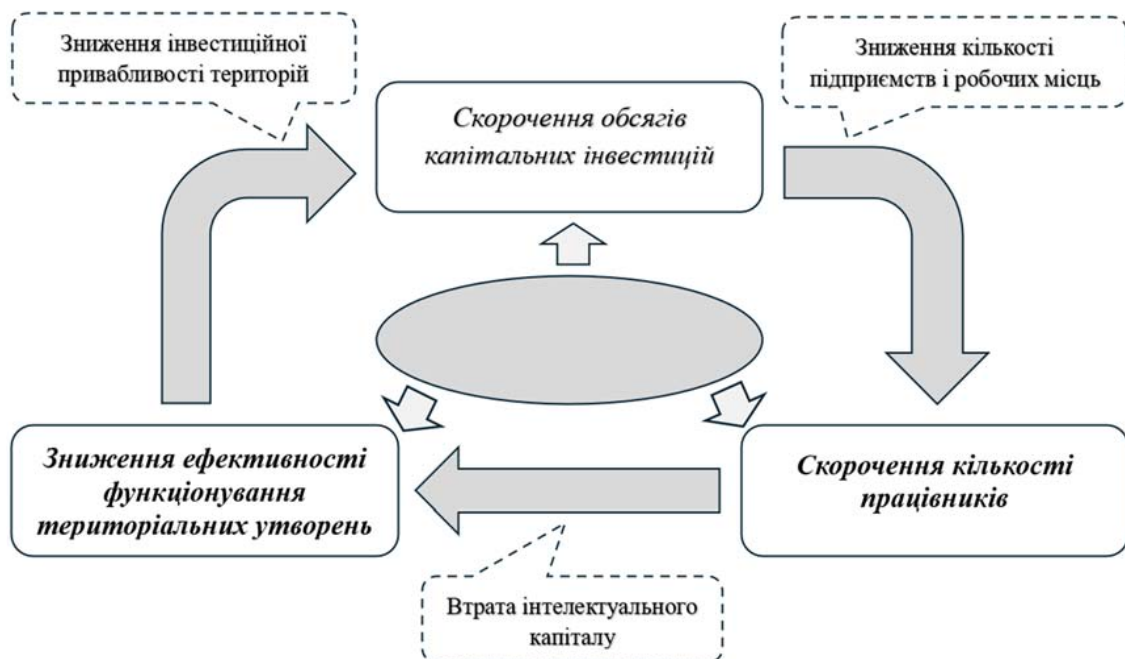
Рис. 1. Зв'язок між чинниками, що впливають на економічний стан територіальних утворень

Для тих територій, що мають спільні кордони з іншими державами важливим чинником є належна організація міжнародної торгівлі, бо можливість здійснення експортно-імпорتنних операцій значно підвищує потенціал регіону. Але, така можливість є не завжди, тому вище відображені чинники, що діють на більшість територій (рис. 1). Варто відзначити, що