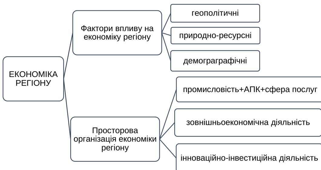
Рис. 1. Спрощена структура економіки регіону

2. Ступінь розвиненості (наявність кваліфікованих кадрів, приватної ініціативи, стартап-майданчики, діяльність громадських організацій, розвиток малого бізнесу, інформаційні потоки).