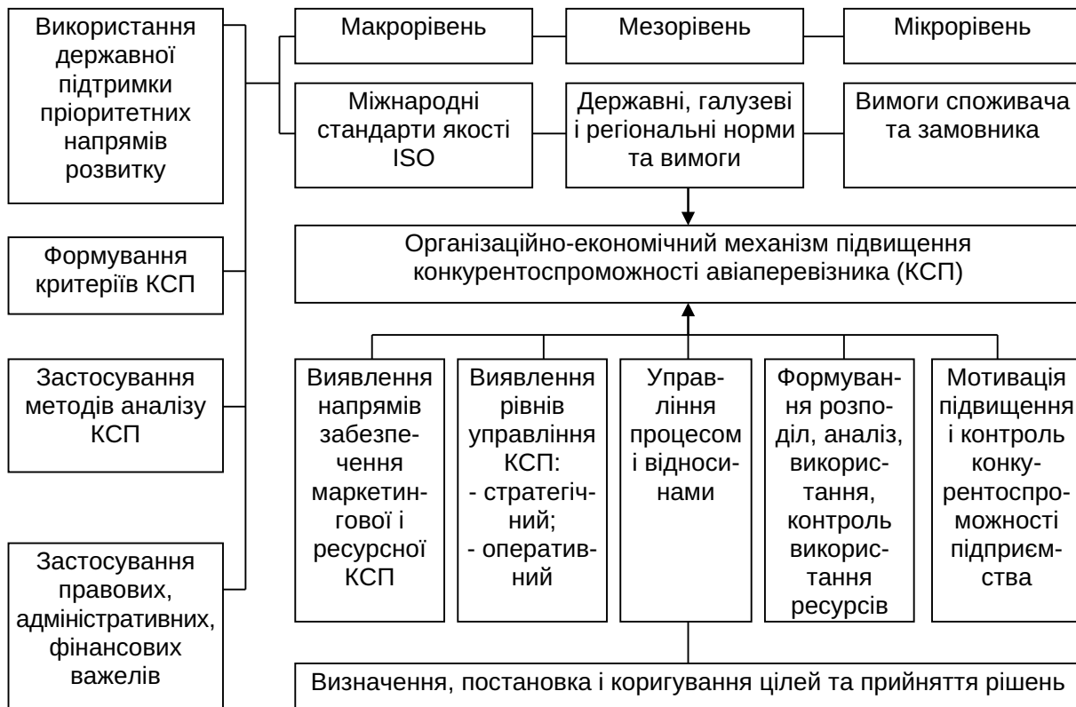
Рис. 2. Елементи організаційно-економічного механізму управління конкурентоспроможністю авіаперевізників на світовому ринку