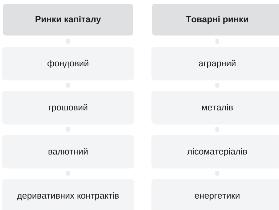
Рис. 1. Види організованих ринків в Україні

Організований товарний ринок надає можливість забезпечити формування відкритої та регульованої системи обігу товарних активів. Біржова торгівля нині забезпечує можливість акумуляції інвестиційних ресурсів за допомо-