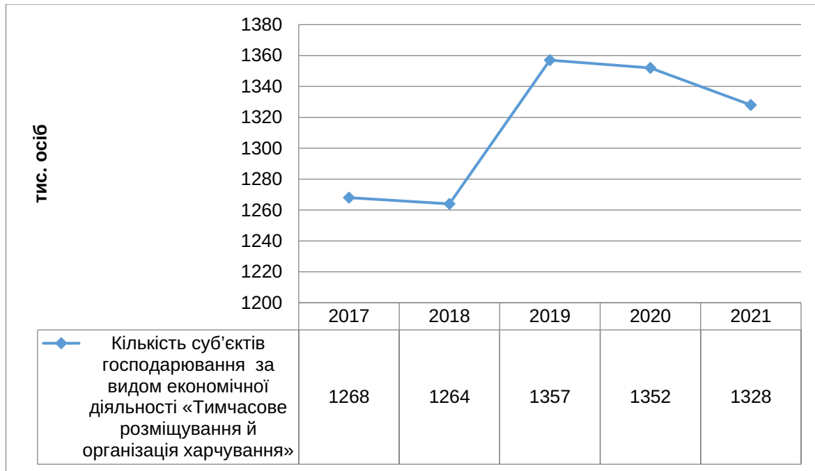
Рис. 1. Кількість суб'єктів господарювання за видом економічної діяльності «Тимчасове розміщування й організація харчування» [1]

татом введення карантинних обмежень, зниження туристичного попиту та загальних економічних труднощів, пов'язаних з пандемією. На початку повномасштабного вторгнення ситуація погіршувалась, через економічну нестабільність та зниження інвестицій з фінансуванням, але з покращенням економічної ситуації більшість закладів почали відновлювати свою діяльність і відкривати нові підприємства. Отже, варто зазначити, що стабільні показники тримаються протягом усього досліджуваного періоду і свідчать про економічну активність в регіоні.