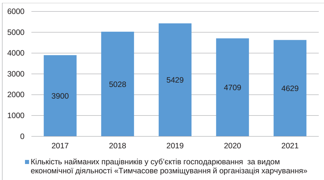
Рис. 3. Кількість найманих працівників у суб'єктів господарювання за видом економічної діяльності «Тимчасове розміщування й організація харчування»