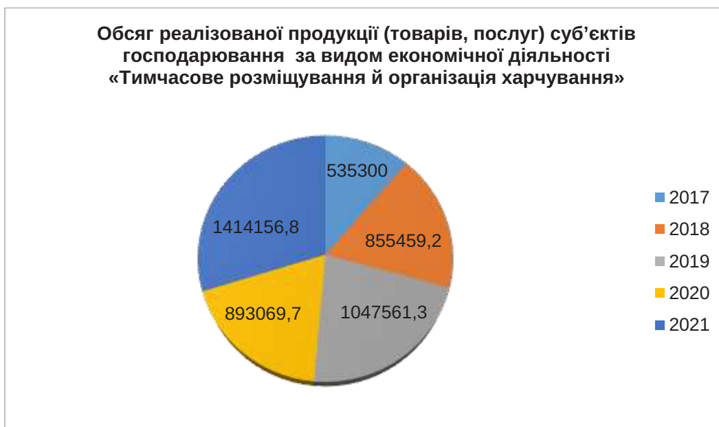
Рис. 4. Обсяг реалізованої продукції (товарів, послуг) суб'єктів господарювання за видом економічної діяльності «Тимчасове розміщування й організація харчування»