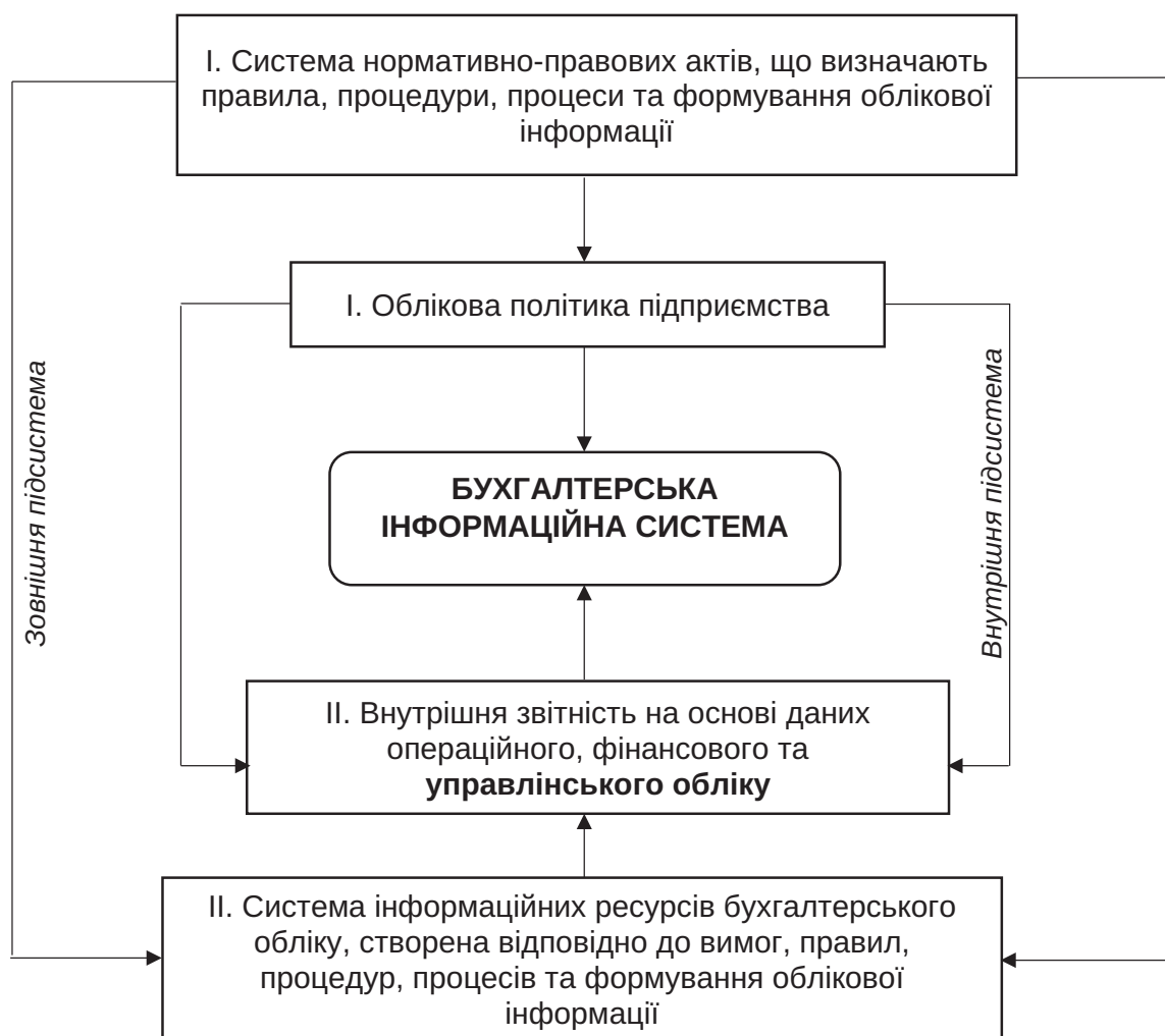
Рис. 2. Управлінський облік у бухгалтерській інформаційній системі підприємства