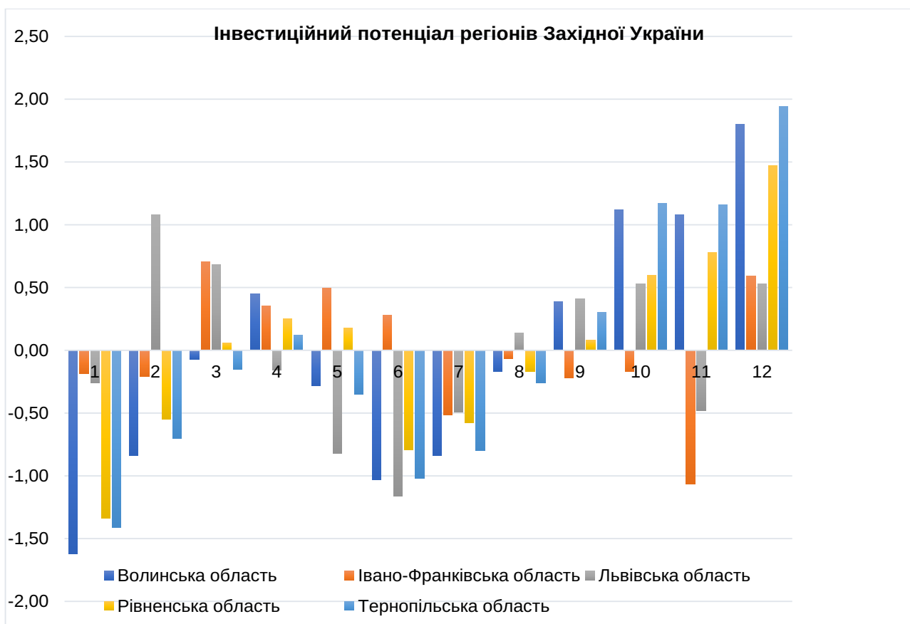
Рис. 1. Динаміка значень показника інвестиційного потенціалу регіонів західної частини України за період з 2010 по 2021 роки