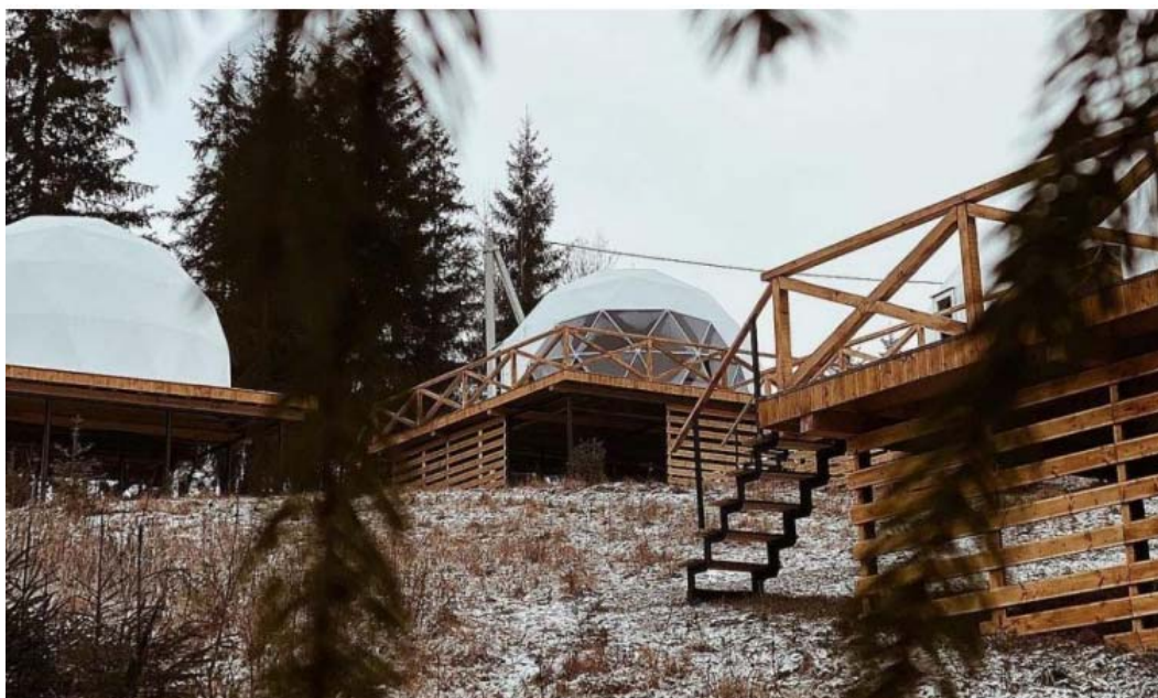
Рис. 2. Еко-глемпінг в Карпатах, с. Кривопілля, Івано-Франківська область, Україна