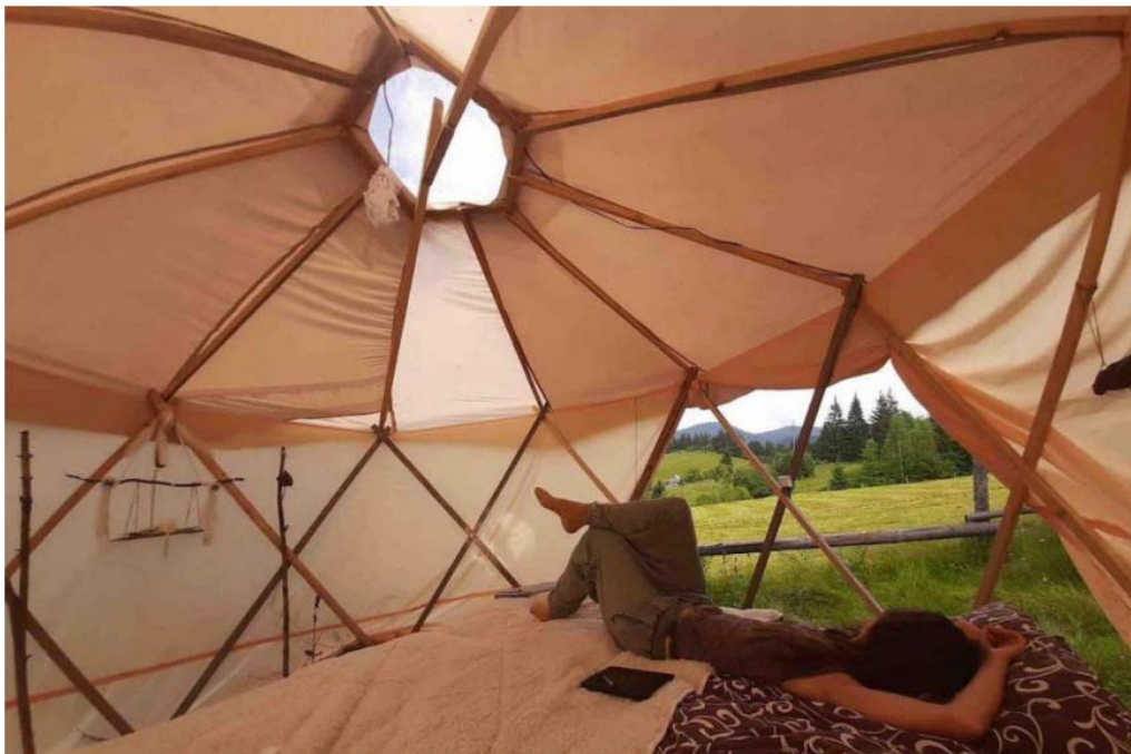
Рис. 1. Глемпінг у формі сфери «Gm Eco Bubble», Яблуниця, Івано-Франківська область, Україна