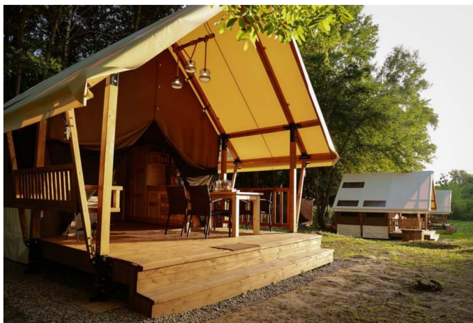
Рис. 3. Глемпінг «Шатро», село Уляники, Київська область, Україна