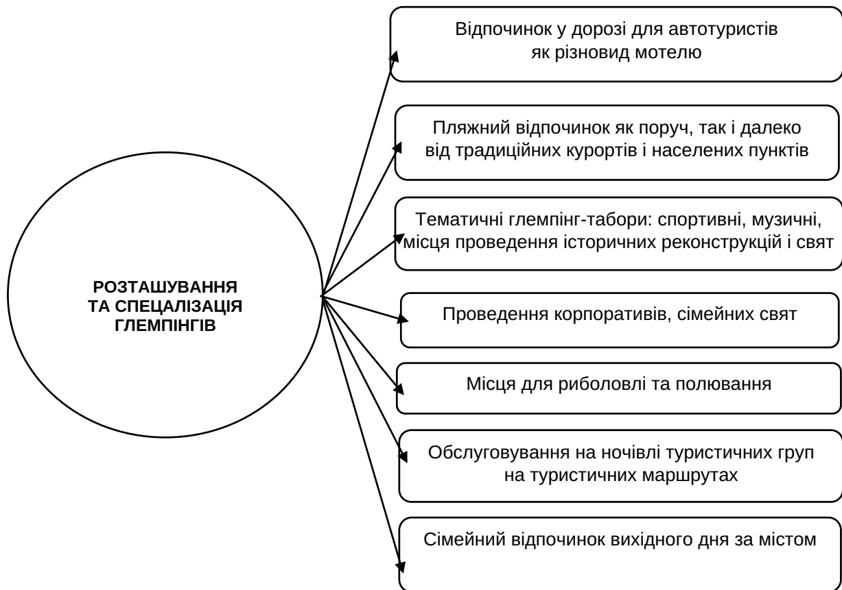
Рис. 5. Розташування глемпінг-туризму, відповідно до спеціалізації