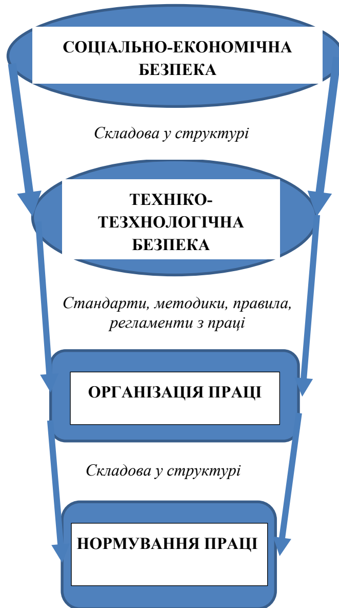
Рис. 1. Вплив соціально-економічної безпеки на нормування праці

Техніко-технологічна безпека – це складова соціально-економічної безпеки підприємства, пріоритетним завданням якої є захист від негативних чинників з метою створення та найбільш ефективного використання техніко-технологічної бази та технологічних виробничих процесів для забезпечення високого рівня конкурентоспроможності підприємства на ринку [9, с. 82].