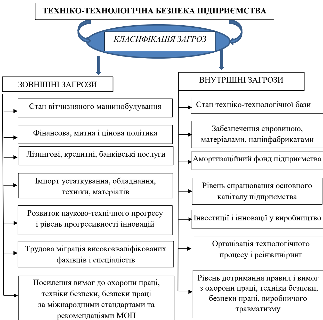
Рис. 2. Класифікація загроз техніко-технологічної безпеки підприємства

Найкращі підприємства харчової промисловості сертифіковані за стандартами ISO 9001 «Системи менеджменту якості» та ISO 22000 «Система менеджменту безпеки харчових продуктів», які аналізують небезпечні чинники і критичні точки контролю