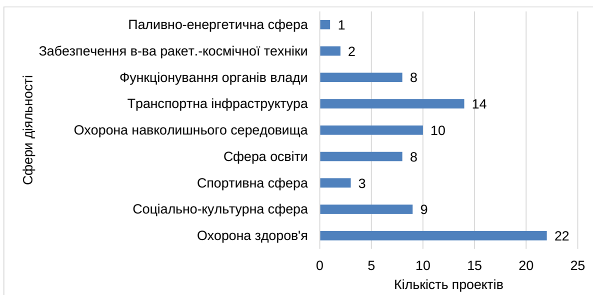
Рис. 1. Розподіл державних інвестиційних проектів за сферами діяльності

Європейська Бізнес Асоціація спільно з Global Business for Ukraine та Ukraine Invest запустила Інвестиційну карту в розрізі регіо-