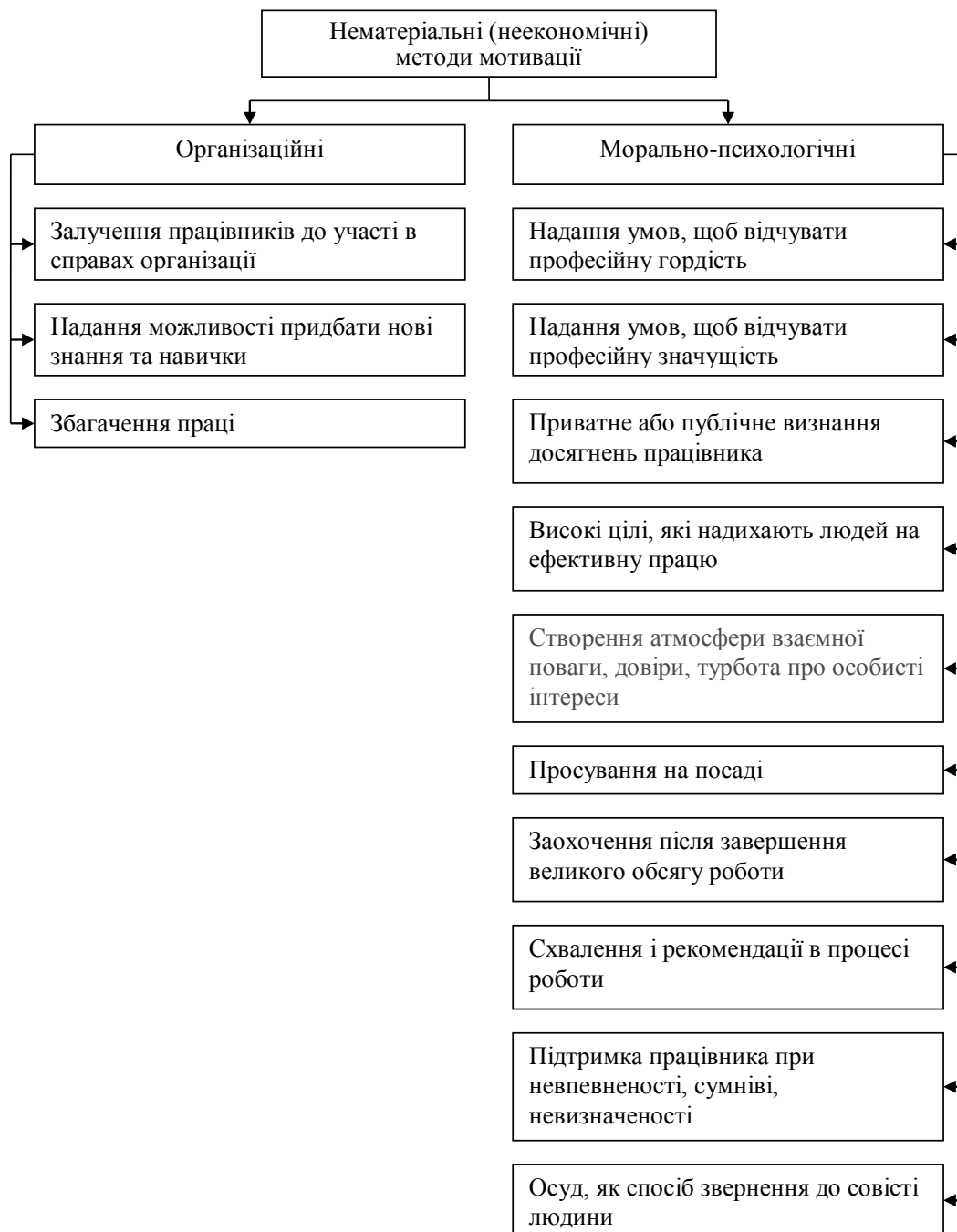
Рис. 2. Види нематеріальних методів мотивації

За даними дослідження Ernst & Young, проведеного в 2008–2009 рр., в умовах кризи багато компаній почали впроваджувати про-