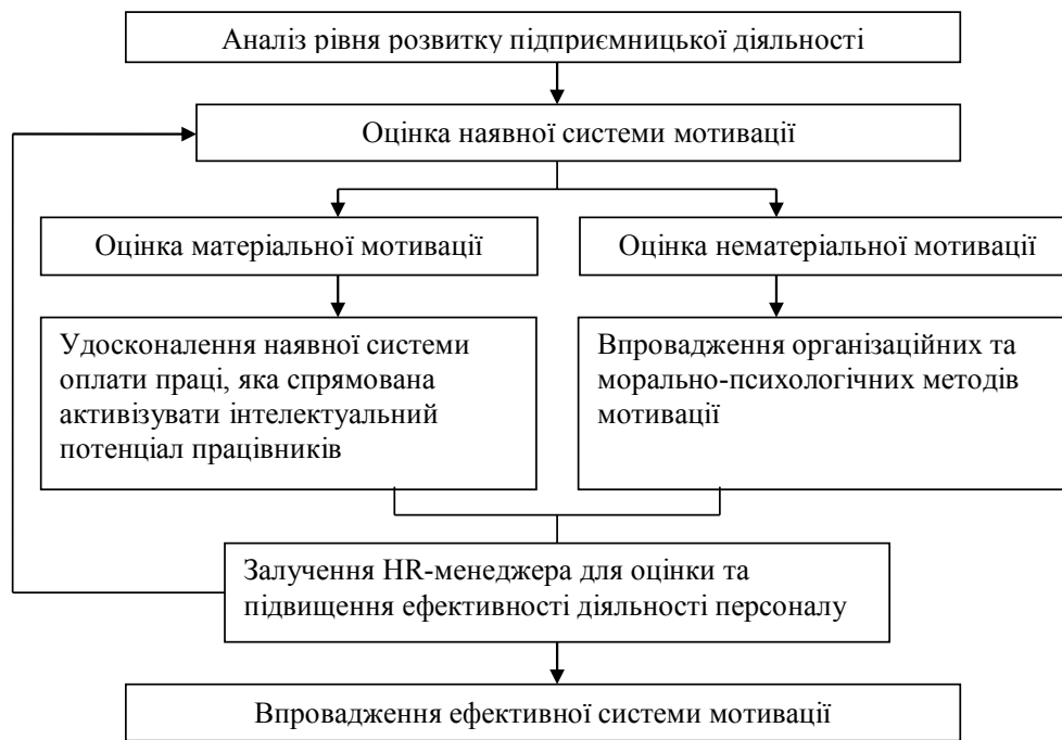
Рис. 2. Схема впровадження ефективної системи мотивації в підприємницьку діяльність

грами оптимізації й реструктуризації. Для прийняття важливих рішень керівництву не вистачало надійної інформації, тому пріоритетним завданням HR-менеджерів стала оцінка ефективності діяльності персоналу [10].