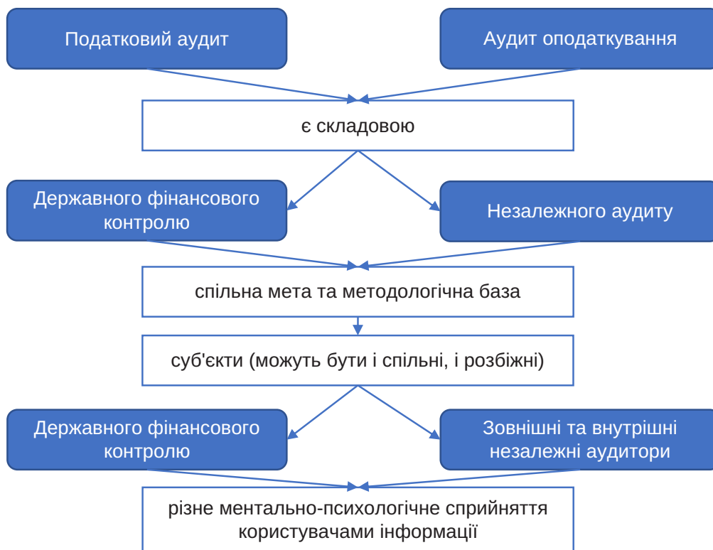
Рис. 2. Порівняльні критерії податкового аудиту

На практиці консалтингові компанії застосовують різні методи податкового планування для того, щоб допомогти підприємствам