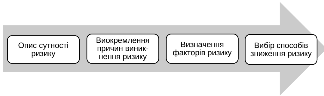
Рис. 2. Схема здійснення якісного аналізу ризиків на підприємстві