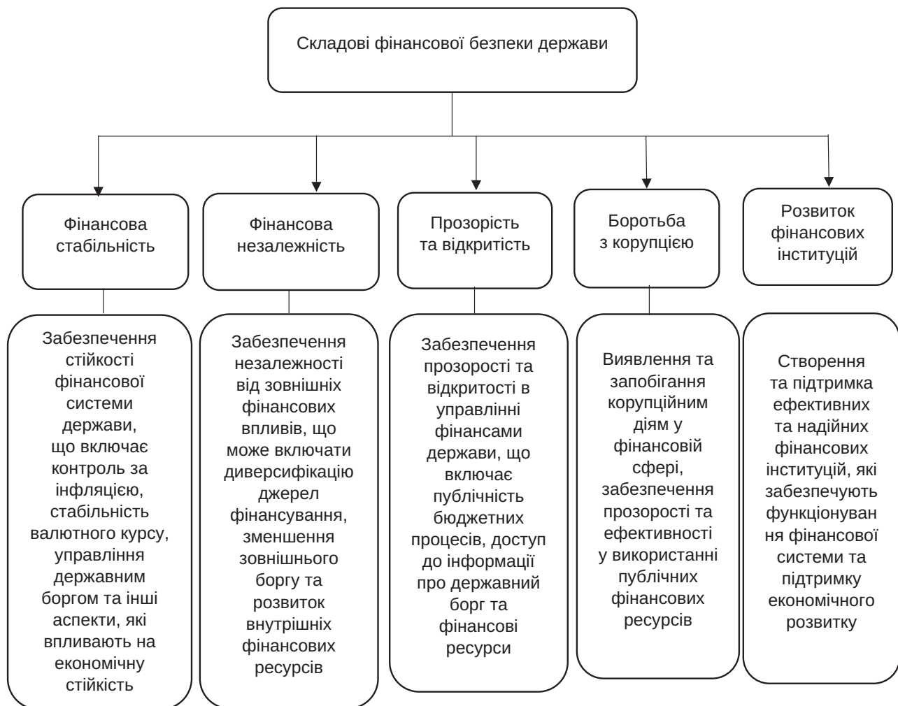
Рис. 1. Складові фінансової безпеки держави

Складові фінансової безпеки держави можна поділити на кілька основних аспектів (рис. 1).