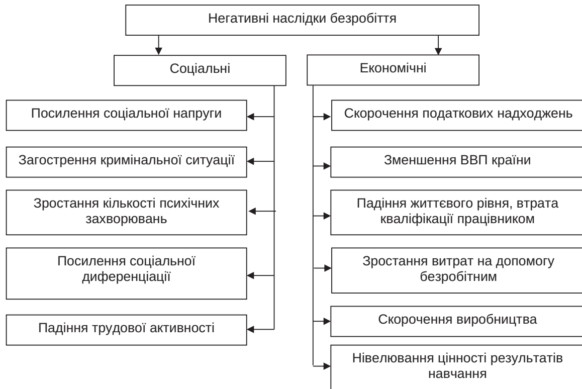
Рис. 1. Соціально-економічні наслідки безробіття