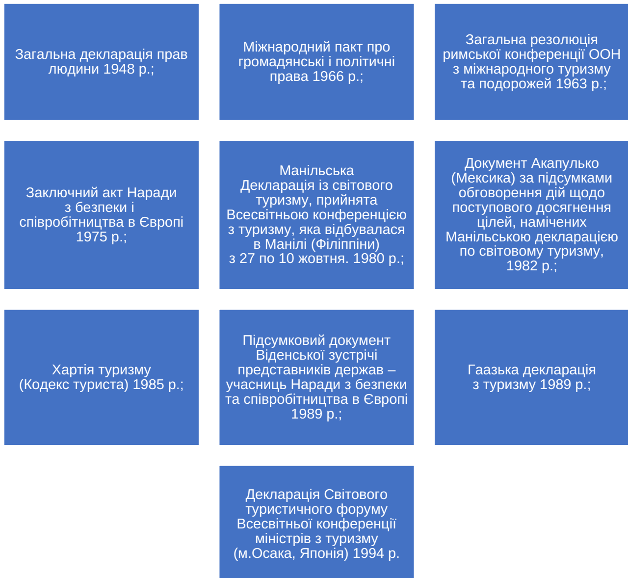
Рис. 1. Міжнародні угоди та конвенції стосовно правового регулювання відносин у сфері міжнародного туризму