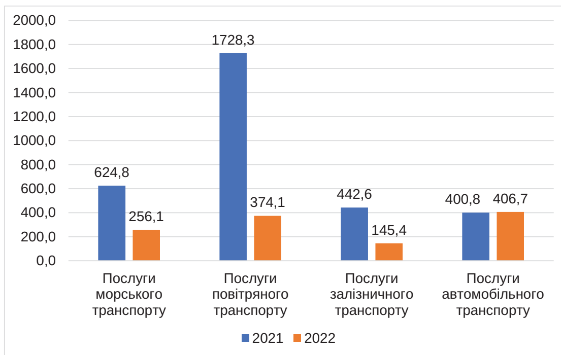
Рис. 2. Порівняльна динаміка структури експорту окремих видів транспортних послуг Україною у 2021 та 2022 роках (млн дол. США)