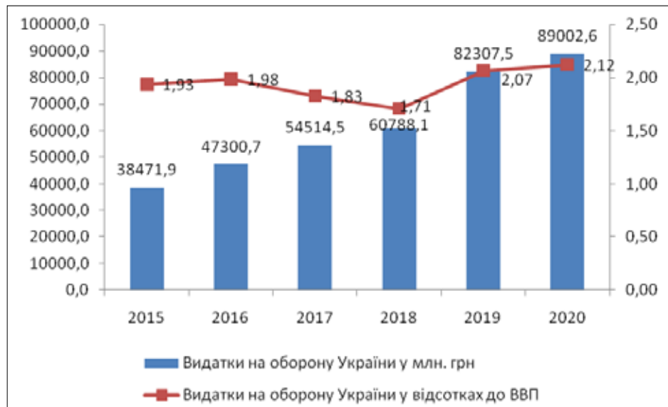
Рис. 2. Динаміка витратів на оборону України у 2015–2020 рр.