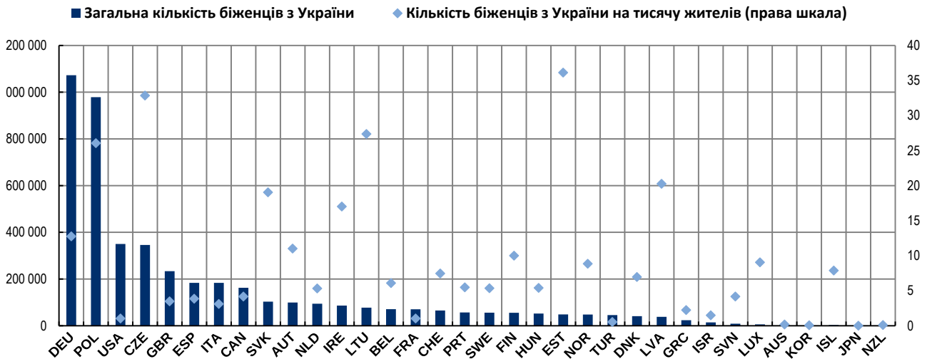
Рис. 4. Кількість біженців з України в країнах ОЕСР, абсолютні цифри та на тисячу населення, червень 2023 року