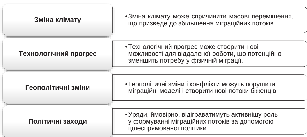
Рис. 5. Основні тенденції міграції та глобалізації в сучасному світі