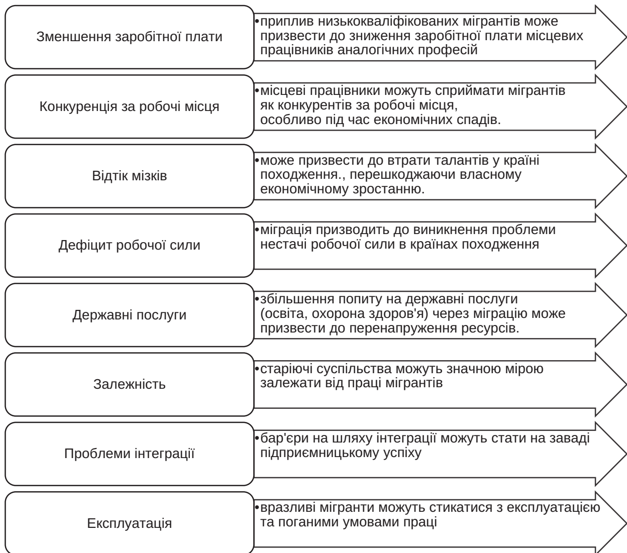
Рис. 3. Негативні аспекти міграції

Дослідження та аналітичні матеріали МВФ та ОЕСР підкреслюють значний позитивний вплив міграції на економіку розвинених країн. У дослідженні, опублікованому МВФ у 2020 році, підкреслюється, що міграція може сприяти економічному зростанню та підвищенню продуктивності праці в приймаючих