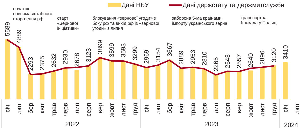
Рис. 1. Експорт товарів у 2022–2024 роках, щомісяця, млн дол.