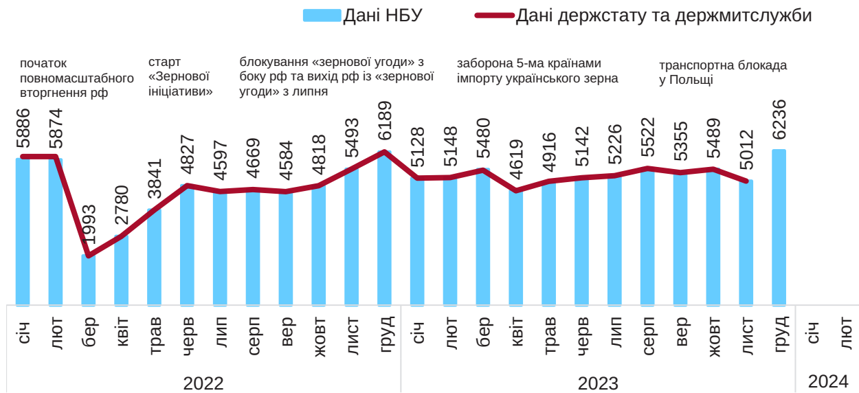
Рис. 2. Імпорт товарів у 2022–2023 роках, щомісяця, млн дол.