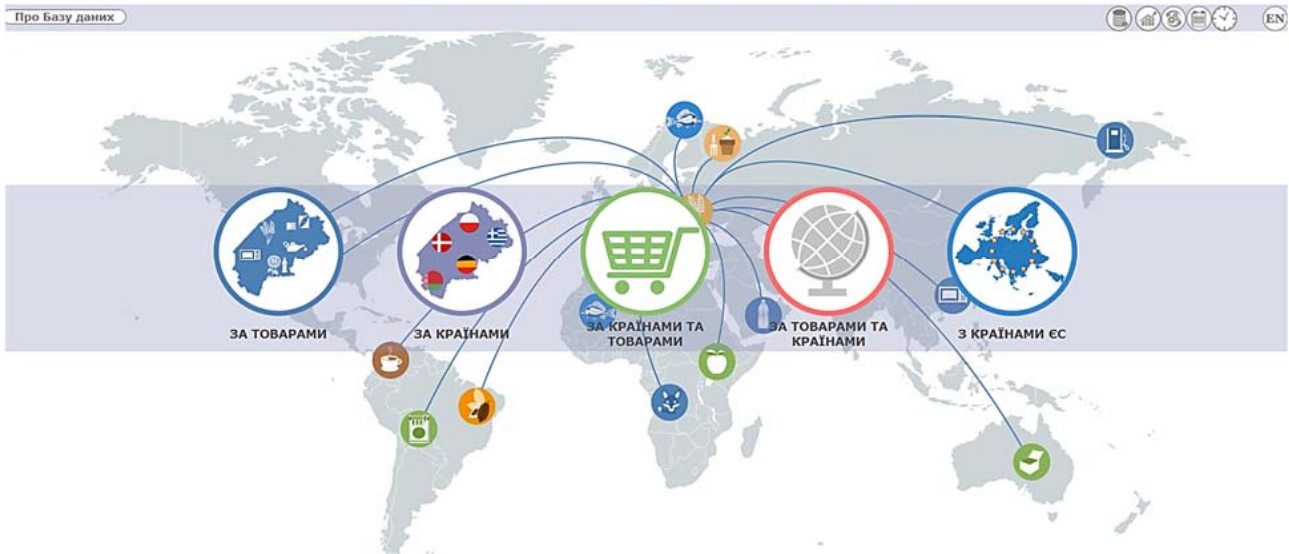
Рис. 1. База даних «Зовнішня торгівля товарами Львівської області»