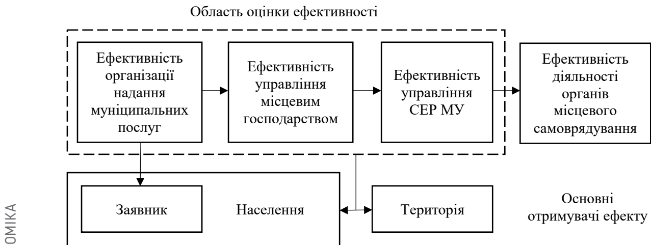
Рис. 1. Види ефективності діяльності органів місцевого самоуправління

Розглянуті приклади систем оцінки ефективності діяльності органів місцевого самоврядування муніципальних утворень зарубіжних країн дозволили зробити висновок, що найбільш результативним є варіант, при якому органи місцевого самоврядування самостійні у виборі показників оцінки своєї діяльності з урахуванням умов розвитку наданої їм території і її стратегічних цілей, а органи державної влади позначають лише загальні контури політики в області підвищення ефективності місцевого управління.