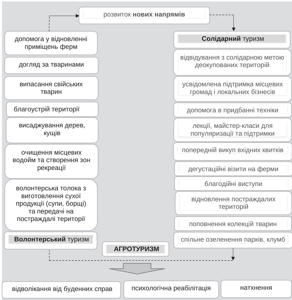
Рис. 2. Волонтерський та солідарний туризм у відновленні агротуризму