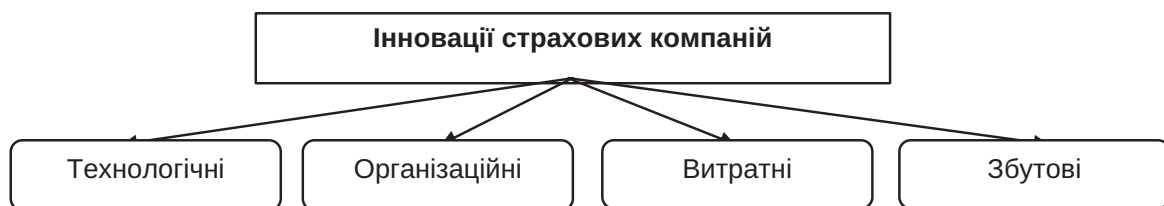
Рис. 1. Види інновацій страхових компаній

Технологічні інновації характеризуються розробкою нових страхових послуг та продуктів, що поєднують у собі найкращі характеристики; вдосконаленням уже наявних на ринку продуктів; зміною технологій процесів супроводу страхових продуктів для автоматизації та удосконалення процесів і, відпо-